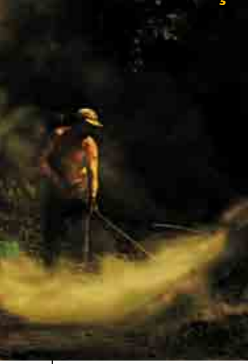
Odun kömürü yapımından bir kesit.