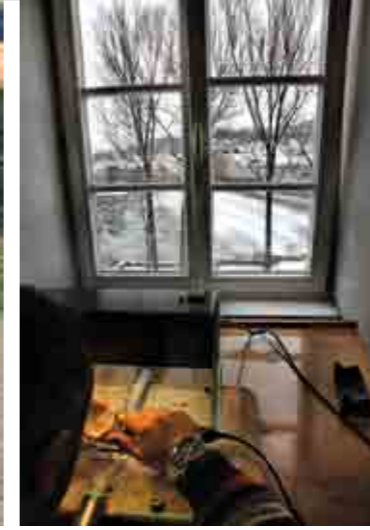
Almanya'da bir diş teknisyeninin çalışma manzarası.