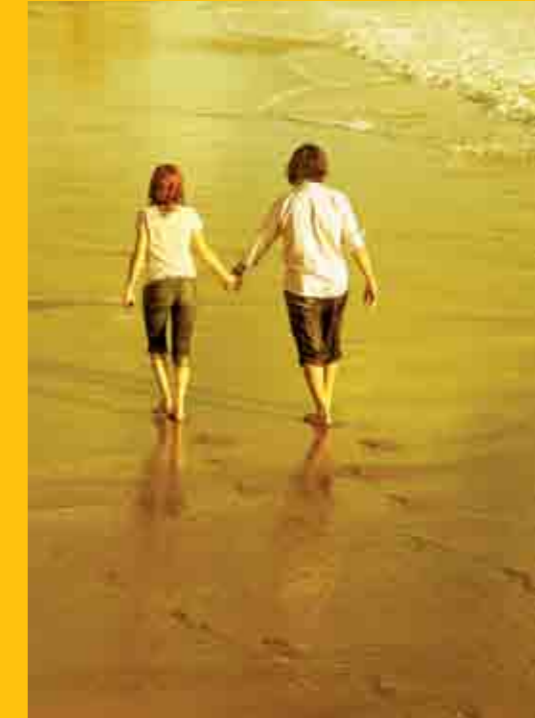
Akdeniz Kıyıları'ndan bir kesit

Fotoğraf çekmek sadece görüntülemekten ibaret değil. Fotoğraf o kadar geniş sınırlara sahip ki, pek çok kültürü, gezmeyi, görmeyi, yaratıcılığı, estetiği, düşünceyi, iletişimi, paylaşımı, empatiyi, gelişimi içeren, son derece dinamik ve engin bir deniz. Değişmeyen tek şey ve tüm bunları sağlarsa ışık. Işığın peşinde koşuyorum.