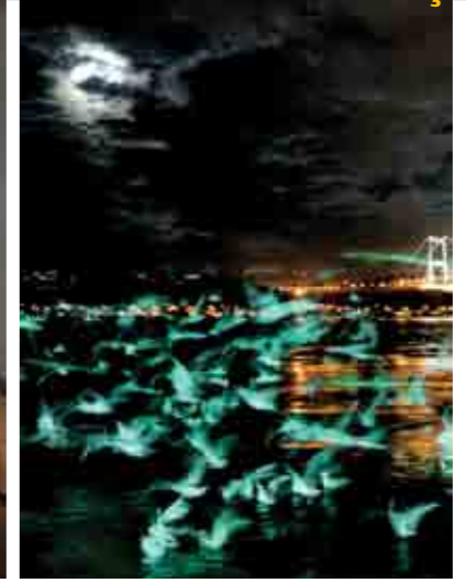
İÜ. Balta Limanı Tesisi'nden çektiğim iki görüntüyü üst üste getirerek hazırladığım bir fotoğraf.