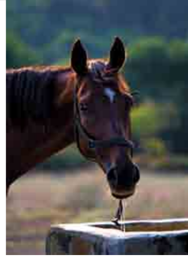
'Sen kimsin' diye soran bir yüz.