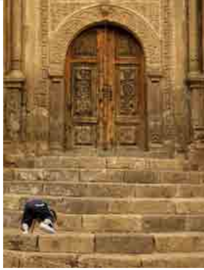
Kapadokya Meslek Yüksekokulu'nun kapısı