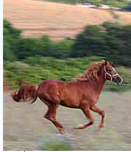
Pan Tekniğine ait ilk uygulamalarından.