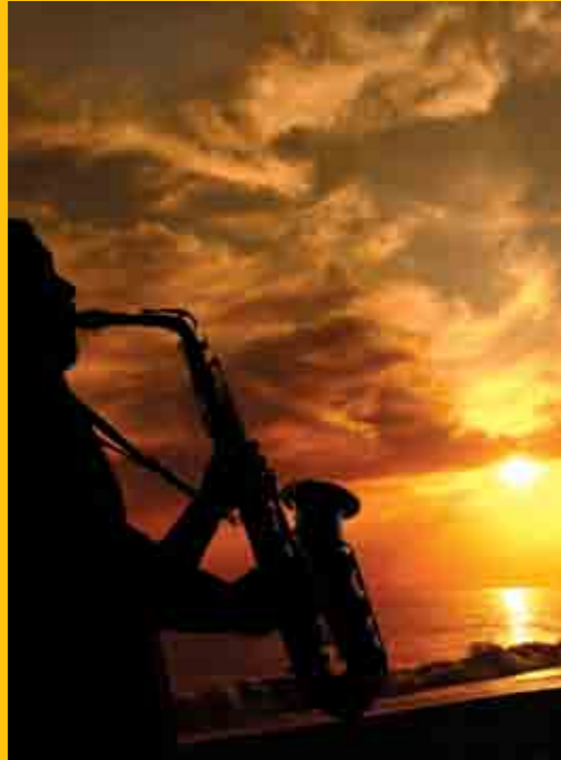
Oğlumun silueti Akdeniz sahilinde... İki fotoğraf üst üste getirilerek hazırlandı.

falarca yazı yazmayı gerektirecek bir konuyu ya da olayı tek bir kareyle anlatma gücüne sahiptir. Eğer bir sanat olayını ya da bir yaşamı görüntülemek istiyorsam o sanatı önce tanımak istiyorum. Yerel yaşamı görüntüleyeceksem tanımak için orada en az bir gün zaman geçirmek ihtiyacı hissediyorum. Bu, kendimi yaşamın içinde hissetmemi, neleri vurgulamam gerektiğini, hangi görüntülerin o sanatı veya yerel yaşamı ifade edeceğini daha iyi belirlememi sağlıyor. Vizörden, her şeyi unutup sadece ifade etmek istediğim görüntüleri büyük bir keyifle belirliyorum. Her çe-