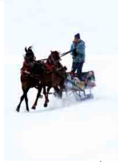
Kars/Çıldır Gölü üzerinde atlı kızak..