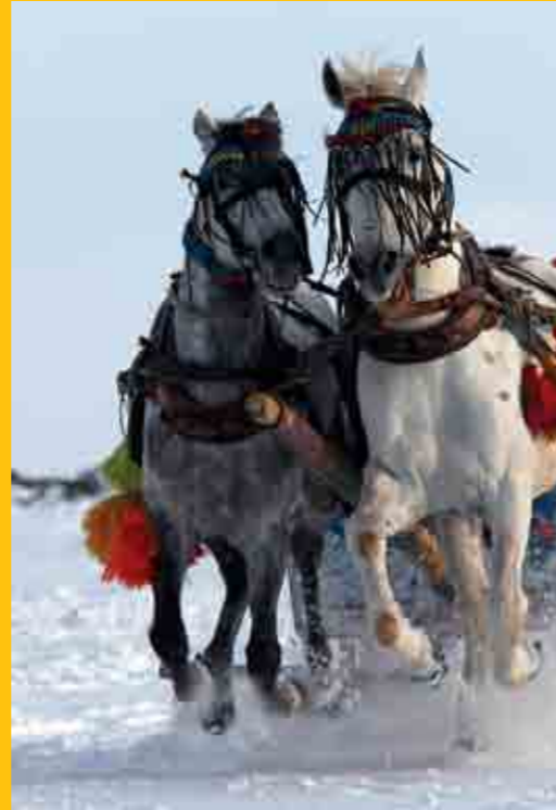
Kars/Çıldır Gölü üzerindeki atlı kızağa ait bir kesit

kim benim için ayrı bir tecrübe, ayrı bir kültür, ayrı bir heyecan, ayrı bir paylaşım... Fotoğraf, çektiğçe daha çok içine çekiyor.