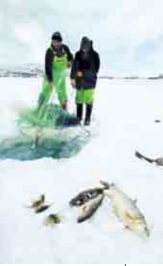
Kars/Çıldır Gölü'nde kışın balıkçılığa ait bir kesit

falarca yazı yazmayı gerektirecek bir konuyu ya da olayı tek bir kareyle anlatma gücüne sahiptir. Eğer bir sanat olayını ya da bir yaşamı görüntülemek istiyorsam o sanatı önce tanımak istiyorum. Yerel yaşamı görüntüleyeceksem tanımak için orada en az bir gün zaman geçirmek ihtiyacı hissediyorum. Bu, kendimi yaşamın içinde hissetmemi, neleri vurgulamam gerektiğini, hangi görüntülerin o sanatı veya yerel yaşamı ifade edeceğini daha iyi belirlememi sağlıyor. Vizörden, her şeyi unutup sadece ifade etmek istediğim görüntüleri büyük bir keyifle belirliyorum. Her çe-